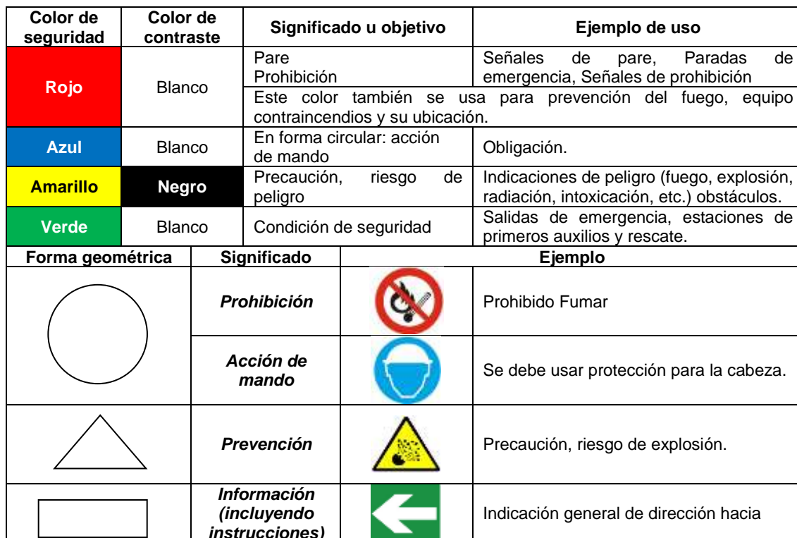
Tabla 1. Señales y Colores

La EMPRESA PÚBLICA DE SERVICIOS ESPOL-TECH E.P. presentará el siguiente tipo de señalización: